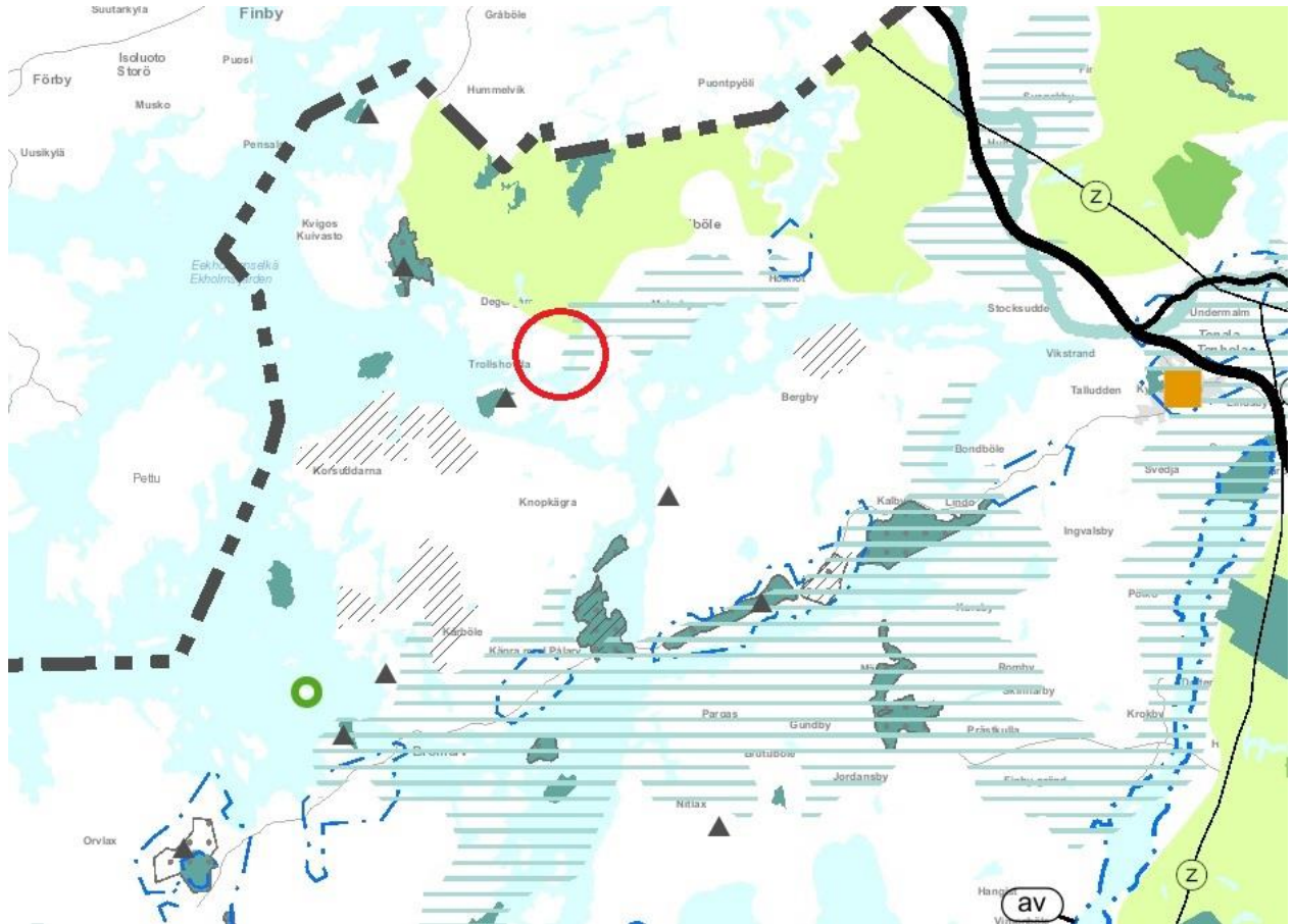
Bild 3. Sammanställning av landskapsplanen

Kulturmiljö av riksintresse och/eller av intresse på landskapsnivå